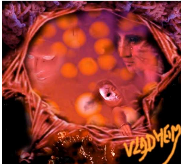
Illustration : Vladheim (Hugues Perrin)