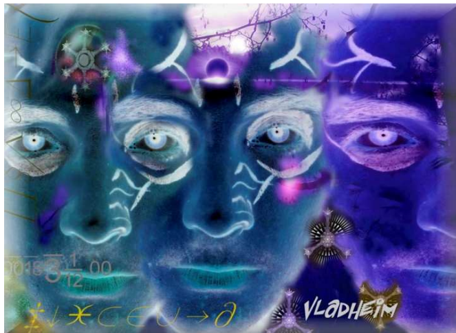
Illustration : Vladheim (Hugues Perrin)