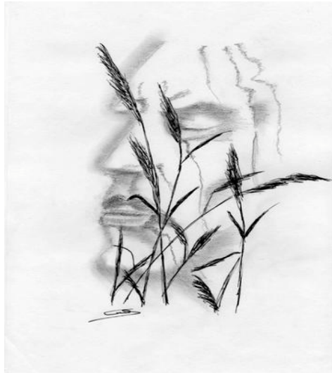
Illustration : Gabie Opaline

Il comptait De son pas mesuré L'espace proche Du gouffre dernier